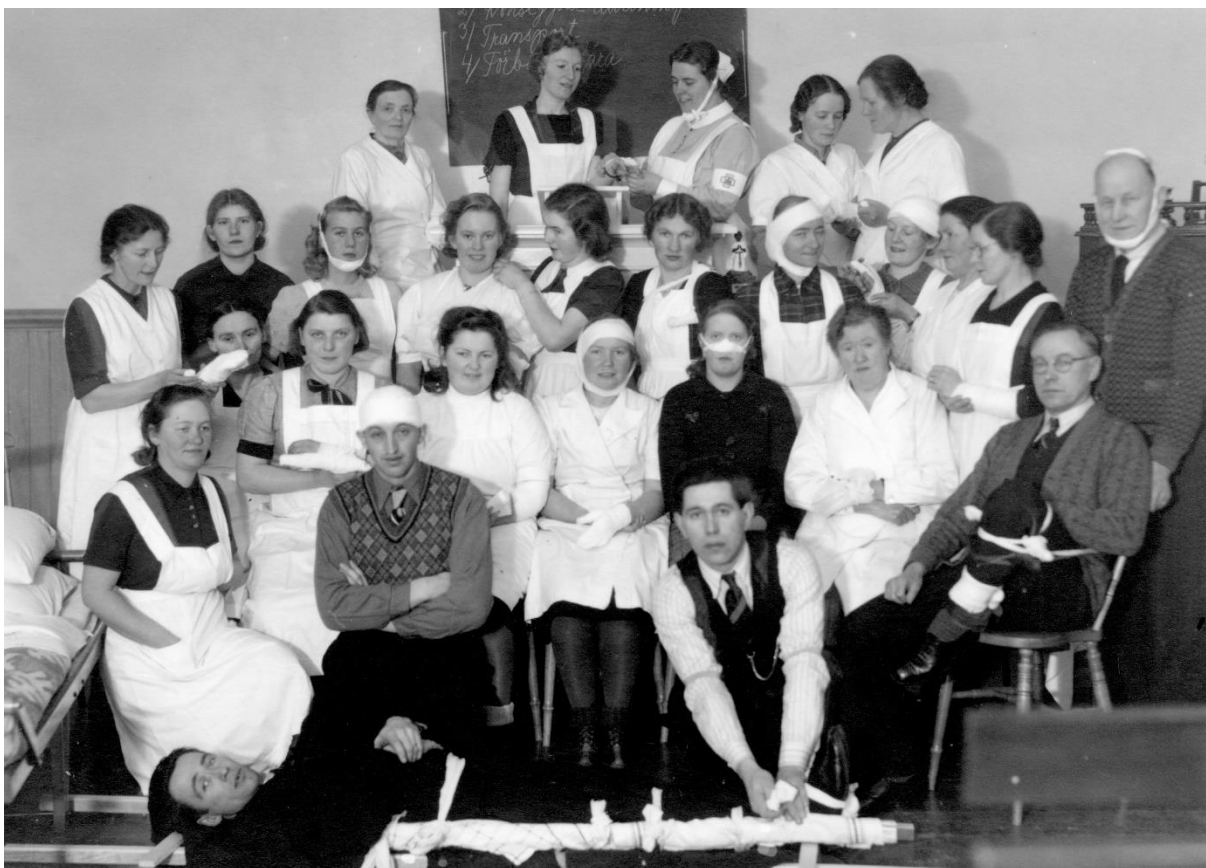
Under kriget hölls även sjukvårdskurser för församlingens medlemmar i missionshuset. Denna bild med en del omplåstrade medlemmar är från en sjukvårdskurs som hölls den 20-25.2 1941. Namn på deltagarna, se bilaga 1.