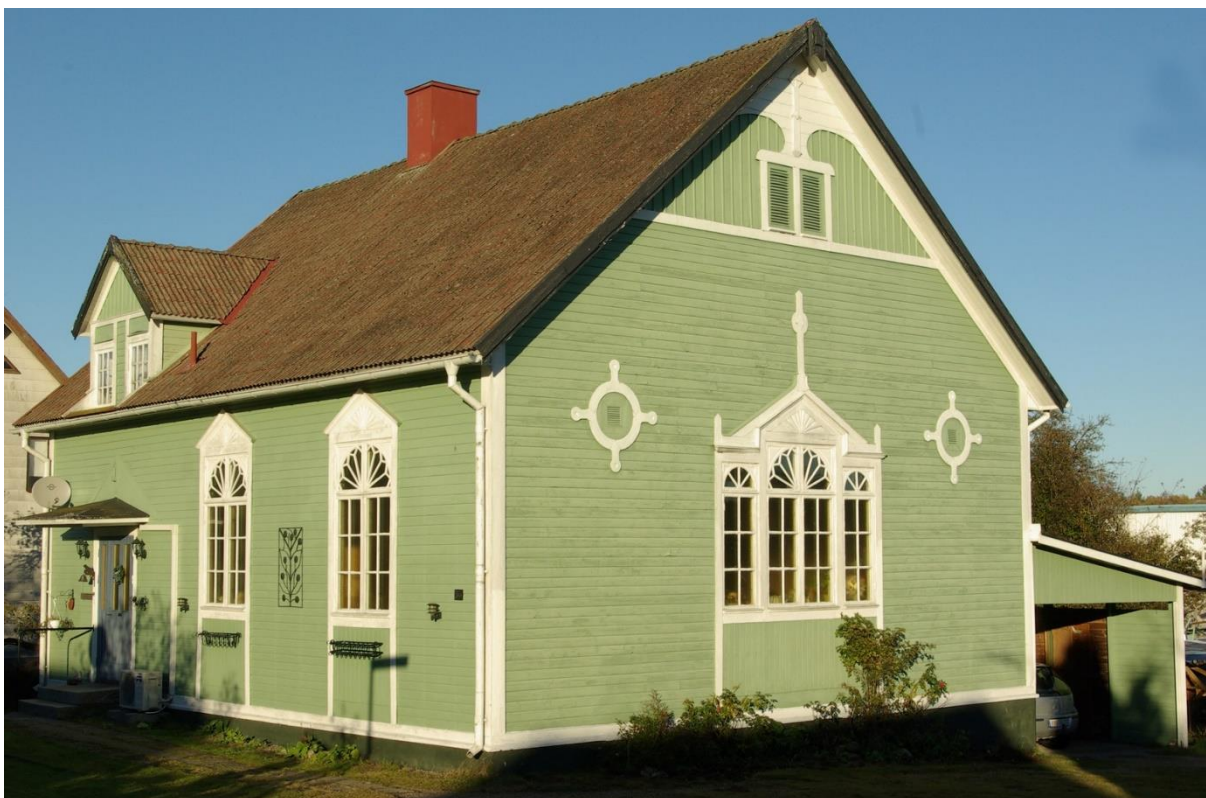
Missionshuset i Bräkne-Hoby som det ser ut idag.