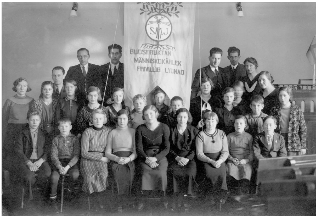
Bräkne-Hoby missionsförsamlings juniorer ca 1940. Namn på personerna, se bilaga 2.