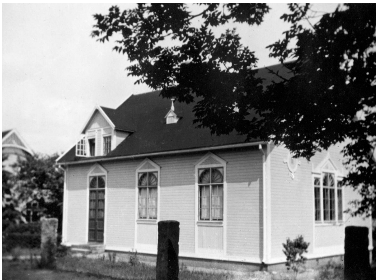
Missionshuset i Bräkne-Hoby under 1930-talet, byggt under 1921. Med tomten inräknad kostade bygget 14 305 kr.

När bygget blev färdigt invigdes det nya missionshuset den 6 januari 1922.